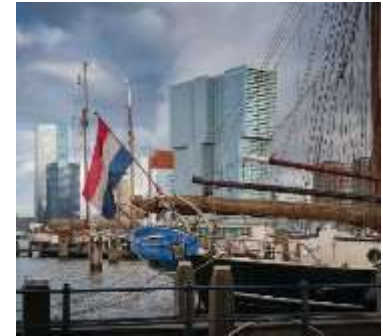
die Nieder- lande (Pl.)